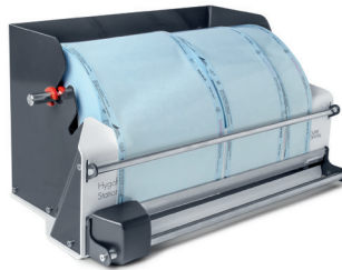
Hygofol Station wandhängend