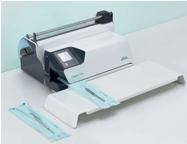
Instrumententisch und Hygofol Station zur Tischaufstellung

Mit dem Zubehör und den Verpackungsfolien aus dem Hygopac System meistern Sie die Arbeit mit links. Der tägliche Siegelnahttest Hygopac Sealcheck ermöglicht die tägliche Kontrolle der Siegelnahtqualität auf einen Blick und bringt so ein zusätzliches Stück Sicherheit.